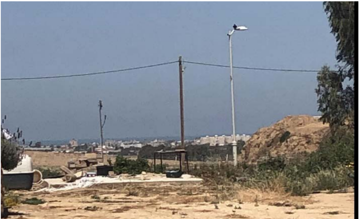
דיר אל בלח - נוף הנשקף מהבית של ההורים שלי בכיסופים.

וכך אני זוכרת אותך אמא אהובה שלי, כי כך באמת ברא אותך הטבע. תמיד היית עם דמיון ומחשבה חופשית ואף פעם לא נלחמת בזה. ידעת מצויין את מי את אוהבת ואת מי לא, ולא היה אכפת לך מי לא אוהב אותך ומה חושבים עלייך. היית כל כך כנה ואמיתית ואמרת לאנשים תמיד את מה שבאמת חשבת. לעיתים היה נעים להם לשמוע ולעיתים ממש לא. אני גאה בך ואוהבת אותך, ולנצח יהיו בי כיסופים אלייך וכיסופים לביתך שהוא גם ביתי בו נולדתי וגדלתי - בית כיסופים. כיסופים לילדות היפה שהייתה לי. כיסופים לכל אותם ימים יפים ושלווים שחוויתי, ואיתי תושבי הקיבוץ ותושבי כל העוטף כולו לפני השבת של ה-7.10.23. אני יודעת בתוך ליבי פנימה, שאת מלמעלה עוד תראי את ההתחדשות של כל אותם נופים ובתים שנהרסו ונשרפו, ואת הפריחה והצמיחה של הקיבוץ ושאר ישובי המועצה והעוטף כולו על כל תושביו, שיחזרו מהבתים הזמניים אליהם פונו וישובו לבתים שיפרחו ויצמחו מחדש. אני כולי תפילה שכל החטופים ישובו במהרה לביתם. יהי זכרך ברוך. אוהבת אותך בלי סוף.