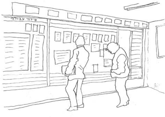
איור: עדי צחור

רשימת התורנויות האין סופית, רשימת הטרמפים לכרך הגדול ולאחות הקטנה והמאובקת, שעות פתיחת הקומונה, כולבו, מרכולית וקופת הבית. מתי שאלו הספר מגיע ואדי האופטרימטריסט. לוח תרבות ולוח חגים, אבידות ומציאות, שיווקי עופות, לידות ופטירות. והכי חשובה רשימת השחקנים של נומוס לכדורגל של שישי (אבוי לו למי שלא נרשם, כי הוא היה מגיע אליו זועף עד לשולחן..)