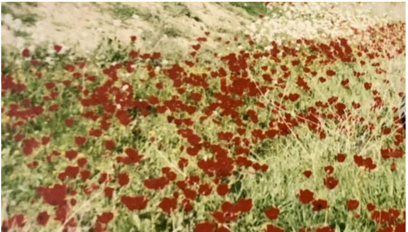
כלניות בשדות כיסופים