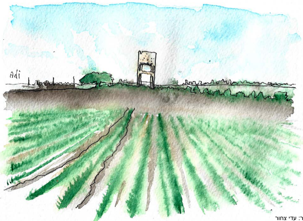
איור: עדי צחור

חלק מהחקלאים לא יחזרו זה ברור לי. חלקם גם יחזרו לאזור אבל יסגרו את הבאסטה ולא יעסקו בחקלאות. למשקים והחקלאים שיחזרו זה יכול לתת בוסט. תהיה קונסולידציה (מיזוג של משקים קטנים) שהייתה נחוצה גם בעבר ועכשיו תהיה הזדמנות. ממוצע הגיל של החקלאים בישראל הוא 62. אם לא יהיה שינוי משמעותי הענף הזה יגווע מהר. השינוי הזה צריך להגיע גם מהתושבים והחקלאים עצמם. אני שומע עכשיו הרבה קולות של אנשים שאומרים "מגיע לי" ומתנים את החזרה שלהם הביתה וזה חורה לי. מבחינתי קודם כל חוזרים הביתה (כמובן כשהמצב הביטחוני יאפשר) ואז באים בדרישות. יקח זמן לשקם את החלקות באזור, אבל לצד הצעדים והפעולות שהמדינה חייבת לעשות צריכה להיות גם היענות ונכונות של התושבים. אף אחד לא יבנה פה מחדש. רק אנחנו