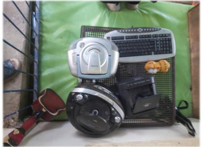
תיבת מכשירים שיוצרים תגובה- פתיחה-סגירה, רעש ועוד