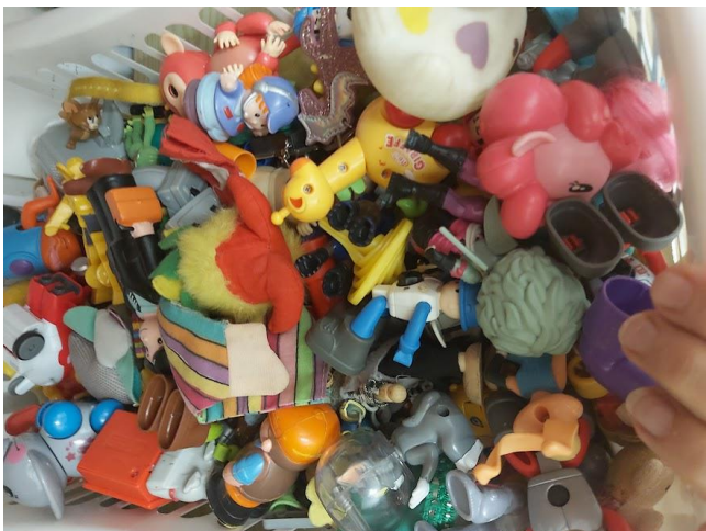
תיבת משחקים ישנים