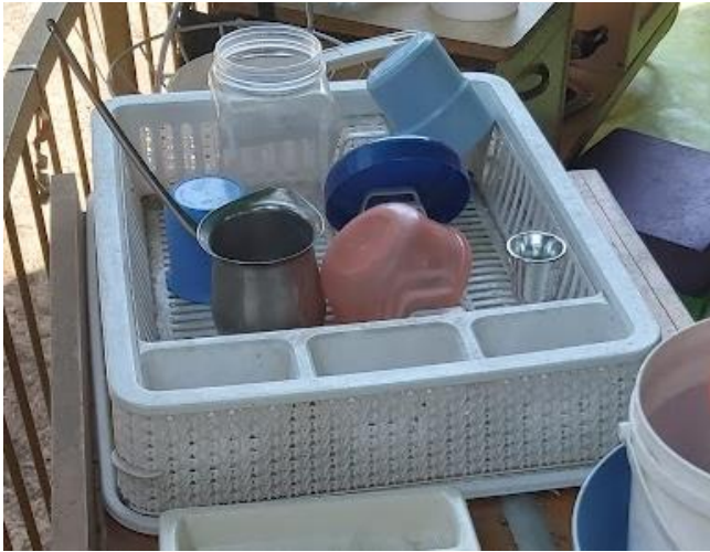
תיבת מכשירים ואביזרי מטבח